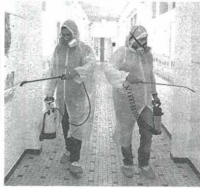
IPAは欧米では消毒用にも使われる「ロイター」

キの溶剤、洗浄剤といった工業用途のほか、消毒剤などに使う。皮膚への刺激が強いとされ、欧米では濃度を下げて保湿成分を混ぜた消毒剤もあるという。日本では手指に使う市販の消毒液には発酵エタノールが使われるが、少量のIPAを含む製品もある。 市場に動きが出始めたのは新型コロナウイルスの3月。東南アジアで「消毒剤をエタノールからIPAへ切り替える動きが出た」と(商社)。アジアでのスポット価格は足元で1ト1500ドル前後と、この2〜3カ月で2倍程度に上昇。欧州でもタンクローリー車による納入価格が3〜4月にかけて2倍以上の同2500ドル前後となった。IPAは世界の生産能力は9 3月。東南アジアで「消毒剤をエタノールからIPAへ切り替える動きが出た」と(商社)。アジアでのスポット価格は足元で1ト1500ドル前後と、この2〜3カ月で2倍程度に上昇。欧州でもタンクローリー車による納入価格が3〜4月にかけて2倍以上の同2500ドル前後となった。IPAは世界の生産能力は9 され、アジアが4割強を占める。欧州は2割弱しかなく、域内生産で不足する分を中国などアジアから調達する。東南アジアでは「複数のプラントで定期修理が重なり、需給の逼迫感が一気に強まった」と(化学大手)。日本では3社がIPAを生産する。生産能力は世界の1割にあたる年22万ト。2019年には9